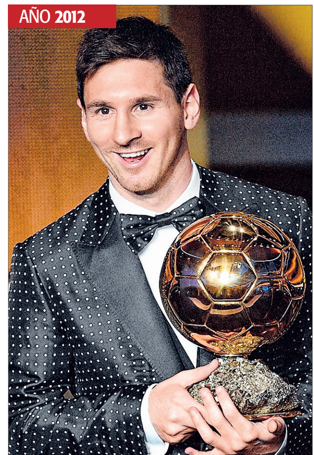
SOLO ANTE LA HISTORIA. El premio conseguido el lunes deja a la Pulga como el único jugador de la historia que ha conseguido cuatro Balones de Oro.