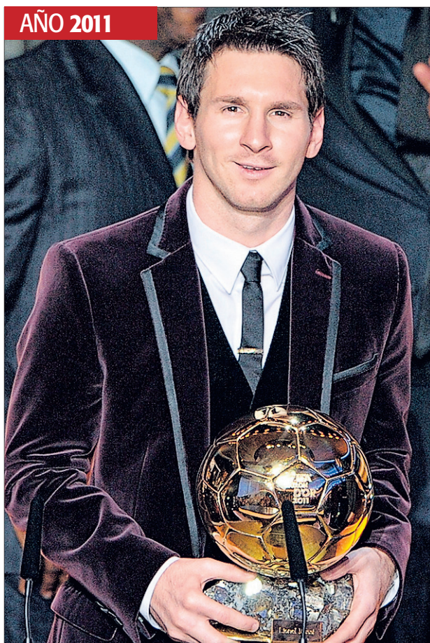
JUNTO A LOS MÁS GRANDES. Con su tercer Balón de Oro, Messi se puso a la altura de Cruyff, Van Basten y Platini. Él, además, los ganó de forma consecutiva.