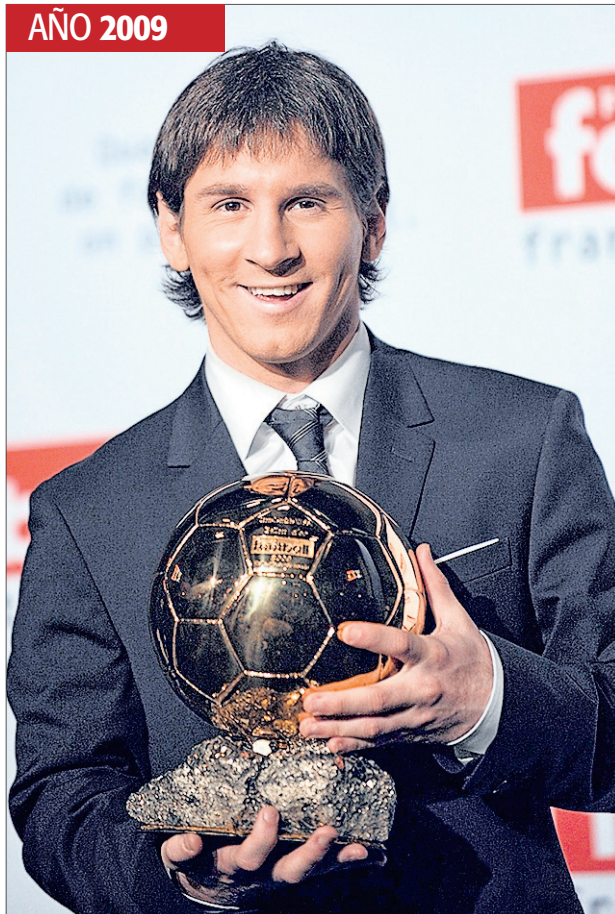
LA PRIMERA VEZ. Messi conquistó su primer Balón de Oro en 2009, cuando ganó seis títulos con el Barcelona (Liga, Copa, Champions, Supercopas de España y Europa y Mundial).

La gran cuenta pendiente de ‘la Pulga’ es la selección de Argentina. Campeón olímpico en 2008 y del mundo sub-20 en 2005, aún no ha podido levantar ningún trofeo con la absoluta. Su rendimiento con la albiceleste fue duramente cuestionado durante mucho tiempo, pero en 2012 pareció encontrar su sitio entre sus compatriotas, logrando igualar la marca de 12 tantos en un año natural que ostentaba Gabriel Batistuta desde 1998. Messi no solo puede pasarle en ese apartado en 2013, sino en el de goles totales con Argentina. Batigol contabiliza 56, por 31 del azulgrana. ‘La Pulga’ seguirá luchando por romper barreras en este 2013 recién comenzado, en el que el Barcelona sigue vivo en todas las competiciones y Argentina peleará por la clasificación para el Mundial de Brasil. dc