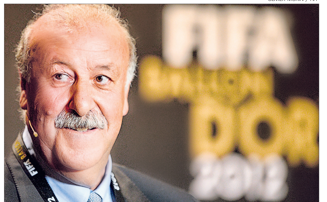
Alegría. Vicente del Bosque sonríe durante la gala en la que fue premiado como el mejor entrenador del 2012.

trenadores, a la gente que se dedica al fútbol. Es también un premio que reposa en el colectivo, en los jugadores, que son los que nos hacen mejores al resto”. El técnico, que en alguna ocasión ha dejado ver que no volverá a entrenar a un club cuando acabe su etapa al frente de España, tendrá al menos dos oportunidades más para demostrar su valía: la Copa Confederaciones de 2013 y el Mundial de 2014, ambos en Brasil.