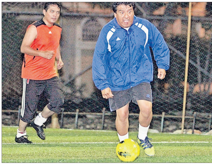
Amistad. Villao lleva a sus trabajadores a jugar con los empleados de Kennedy.