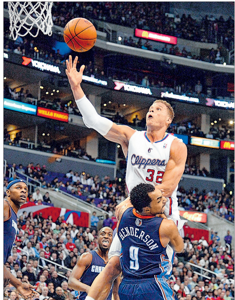
Anotación. Blake Griffin (d) choca con Gerard Henderson (i) de los Bobcats.

El alero LeBron James aportó 40 puntos y el escolta Dwyane