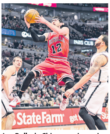
Los Bulls de Chicago se impulsaron 96-85 a los Nets de Brooklyn y siguen segundos en la División Central, superados solo por los Pacers de Indiana.

Philadelphia Sixers 104 - Golden State Warriors 97; Chicago Bulls 96 - Brooklyn Nets 85; Milwaukee Bucks 122 - Toronto Raptors 114; Portland Trail Blazers 109 - Minnesota Timberwolves 94