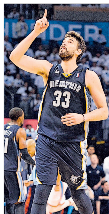
Los Grizzlies de Marc Gasol hicieron historia al clasificarse para las finales. EFE

Su rival será el ganador de la eliminatoria que disputan los Spurs de San Antonio y los Warriors de Golden State, en la cual tiene una ventaja de 3-2 el equipo tejano. EFE