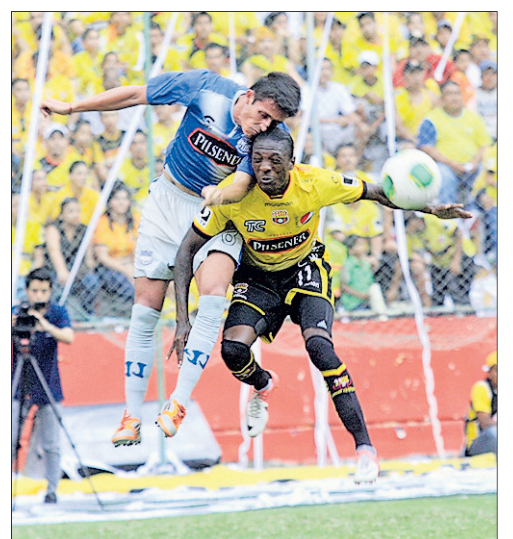
Mondaini sufrió en muchos momentos el repliegue de su propio equipo y no pudo dar lo mejor de sí.