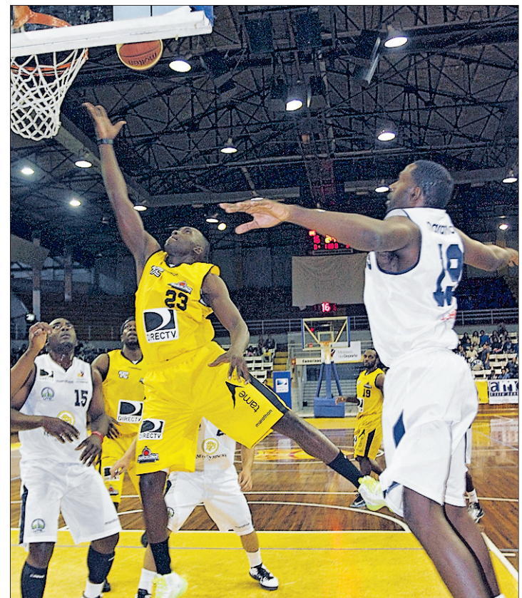
Rendimiento. Barcelona apostó en el partido por jugadas de dos puntos.