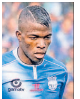
Enner Valencia jugará en México a partir de 2014.

"Es un nuevo paso en mi vida, una nueva enseñanza, tratar de seguir mejorando y si me toca irme tratar de seguir subiendo en lo personal y futbolístico", dijo sobre su traspaso al Pachuca.