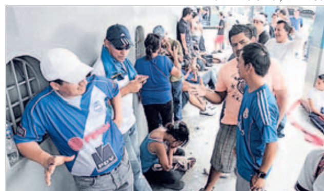
Hinchas azules hacen cola en las taquillas del estadio Capwell.

Emelec abrirá una investigación ante las quejas de los hinchas por el caos que se formó en algunos sitios de venta.